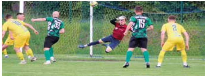
7 czerwca Jedność (żółte stroje) przegrała ze Zniczem Kłobuck 1:3.

niówki. Wygrało Tempo 1:0. Natomiast Jedność 32 Przyszowice, grająca szczebel wyżej w ligowej hierarchii, bo w V lidze, zakończyła sezon 14 czerwca w Żarkach. Drużyna z Przyszowice ograła tam miejscowych Zielonych aż 5:0. Końcowe miejsca w ligowych tabelach i dorobek