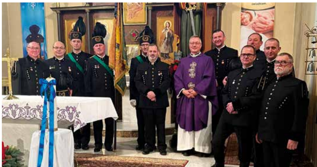
Uroczysta msza święta w kościele pw. św. Urbana w Paniówkach.