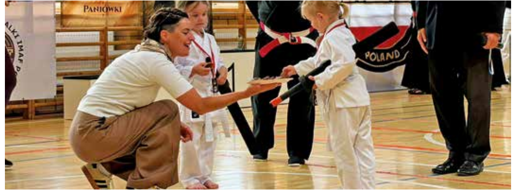
Medal ze słodkim ciasteczkiem smakuje najlepiej.